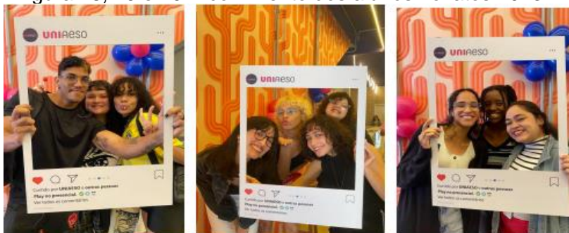
Figura 18, 19 e 20: Acolhimento dos alunos novatos 2023.2.