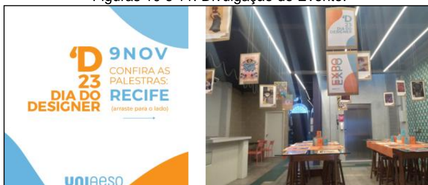
Figuras 10 e 11: Divulgação do Evento.

Dia do Designer - Com o objetivo de trazer práticas do mercado de trabalho para os alunos, fazendo com que os estudantes entendam melhor o setor. Na ocasião teremos várias oficinas e exposições. Em 2023, palestras e oficinas foram oferecidas aos cursos de Design Gráfico e Design de Animação, trazendo renomados nomes do mercado de design para que os alunos compreendam e enxerguem o fantástico mercado de trabalho no mundo do design