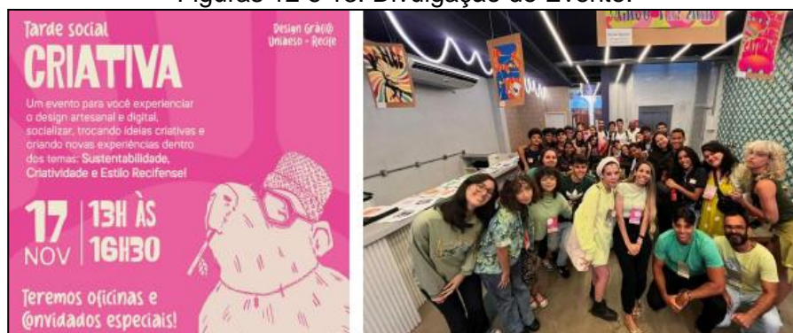
Figuras 12 e 13: Divulgação do Evento.

Tarde Social Criativa - é um evento social criativo voltado para os alunos de Design Gráfico da Uniaeso Recife com o intuito de receber convidados especiais, como alunos de colégio públicos e privados (concluintes e que desejam ingressar na universidade), para experienciar o design artesanal e digital, socializar, trocando ideias criativas e criando novas experiências dentro dos temas: Sustentabilidade, Criatividade e Estilo Recifense, além de exposições dos trabalhos dos alunos do curso de Design Gráfico da Uniaeso Recife.