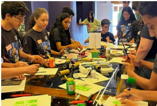
Figura 14: Alunos realizando atividades durante o Evento.

gráfica do evento como: Crachás, Adesivos dos Visitantes, Cartazes, Bottons e Plaquinhas para decoração do evento.