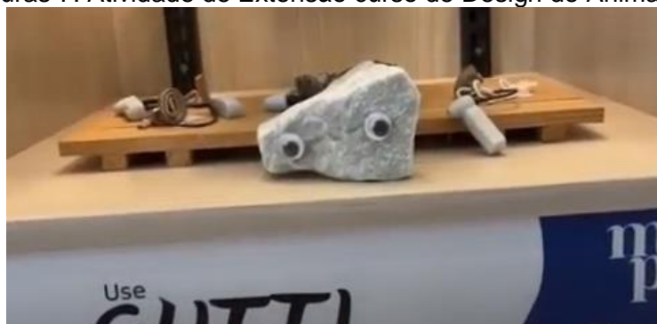
Figuras 7: Atividade de Extensão curso de Design de Animação.