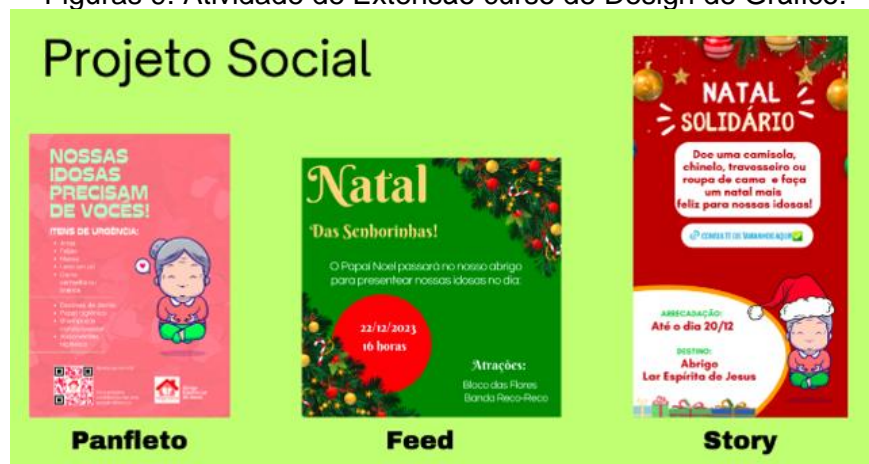
Figuras 9: Atividade de Extensão curso de Design de Gráfico.

O Projeto de extensão do Curso de Design Gráfico – A Atividade de Extensão foi desenvolvida utilizando o Método Design Sprint. O Google's Design Sprint é um método de abordagem de 05 (cinco) dias que se baseou no Design Thinking e na cultura do Hackatons (uma maratona de criação de caráter colaborativo e interdisciplinar com o objetivo de reunir vários setores culturais e criativos). A ONG - Instituição filantrópica-ABRIGO ESPÍRITA LAR DE JESUS foi uma das instituições visitadas pelos alunos. O Intuito do projeto foi criar uma campanha visual para ajudar na arrecadação de materiais de necessidades básicas e doações permanentes por meios da Redes Sociais do abrigo: Instagram, fazendo uma padronização e melhoramento, e rebranding da marca da ONG.