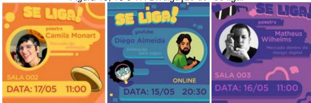
Figura 15, 16 e 17: Divulgação do “Se liga!”

Se liga! - Evento com palestras, oficinas para os estudantes dos cursos da IES. Uma semana de palestras e oficinas destinados aos alunos. A ideia dos encontros foi trazer práticas, conceitos e profissionais do mercado para ampliar a percepção dos estudantes em relação à área, bem como mostrar a importância de investir tempo e dedicação no aprimoramento profissional qualificado dentro do mercado de trabalho.