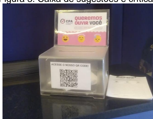
Figura 3: Caixa de sugestões e críticas.

Como proposta inovadora, a CPA utilizou em 2023 o instrumento de coleta de dados complementar – as Caixas de Sugestões e Críticas . As caixas ficam disponíveis durante todo ano e estão colocadas em 2 (dois) pontos da IES – recepção e biblioteca. A comunidade acadêmica pode apresentar suas sugestões ou críticas no formulário físico ou no formulário digital através de QR Code. O objetivo desse Instrumento é promover a maior participação de todos no processo de melhoria da IES, possibilitando uma autoavaliação em qualquer período do ano. A CPA faz um levantamento das demandas que são apontadas e encaminha aos setores responsáveis. Posteriormente, cada setor informa para a CPA as ações que estão sendo providenciadas.