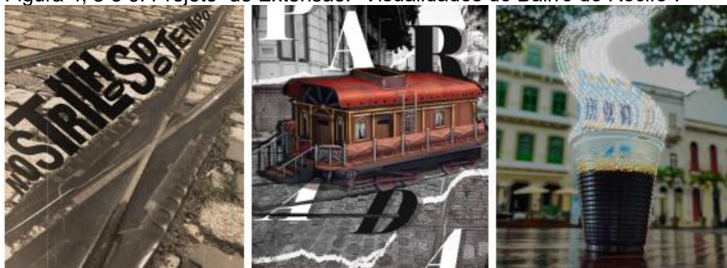
Figura 4, 5 e 6: Projeto de Extensão: “Visualidades do Bairro do Recife”.