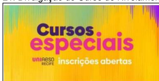
Figura 21: Divulgação do Curso de Nivelamento 2023.

O Programa de Nivelamento é uma política da IES. O Curso de Nivelamento é oferecido gratuitamente a todos os alunos da UNIAESO independente do período que cursa. Seu objetivo é identificar e minimizar as dificuldades ou deficiências existentes na formação dos alunos. O Programa tem a função de auxiliar o discente em seu trajeto acadêmico evitando dessa forma a desistência e /ou evasão.