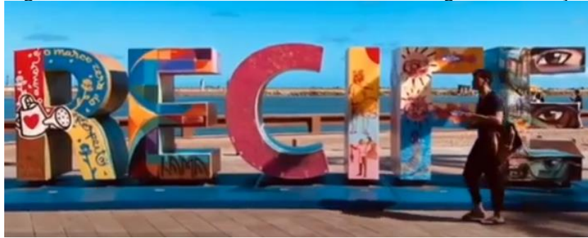
Figuras 8: Atividade de Extensão curso de Design de Animação