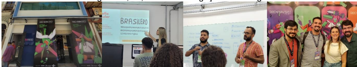
Figura 18, 19, 20 e 21: Divulgação do “Se liga!”

temas de Arte Sonora, Linux, Armazenamento de Dados, Mobilidade Urbana e Ferramentas para Alfabetização para Portadores de Síndrome de Down.