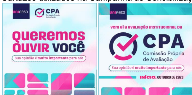
Figuras 1 e 2: Cartazes utilizados na Campanha de Sensibilização - CPA/2023.

A Comissão Própria de Avaliação, com o intuito de fomentar a cultura da autoavaliação institucional, realizou a campanha ao longo de 2023 de sensibilização e de mobilização, junto à comunidade acadêmica. Foram feitas publicações nas redes sociais (Site e Instagram), avisos por aplicativo de mensagens (WhatsApp) e e-mail foram utilizados para sensibilização de alunos, professores e técnico administrativo para o processo de autoavaliação.