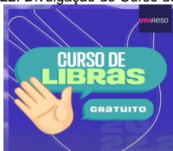
Figura 22: Divulgação do Curso de Libras.

Em atenção ao Decreto nº 5.626/2015, a IES implantou a disciplina LIBRAS desde 2011, como componente curricular optativo em todos os cursos de graduação. A instituição também disponibiliza para o auxílio do docente um professor de Línguas Brasileiras de Sinais (LIBRAS).